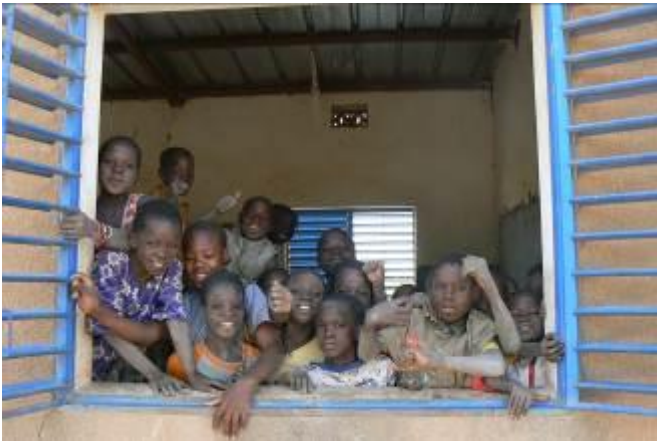
Les élèves de Babou vous accueillent

L'ancienne école du village de Babou, construite en 1987 est dans un état très délabré et constitue un danger pour les enfants et leurs enseignants qui doivent quitter les lieux à l'approche de la saison des pluies et de ses vents violents. L'état actuel ne permet pas une réfection. Il nécessite une construction sur un nouveau site déjà trouvé et réservé. Le projet va bénéficier aux 101 élèves déjà scolarisés dans l'ancienne école. Mais dans le contexte actuel, des enfants habitant dans le secteur de recrutement de l'école vont s'inscrire plus loin, dans d'autres écoles. Ainsi, c'est une quarantaine d'enfants supplémentaires qui sont scolarisables à Babou.