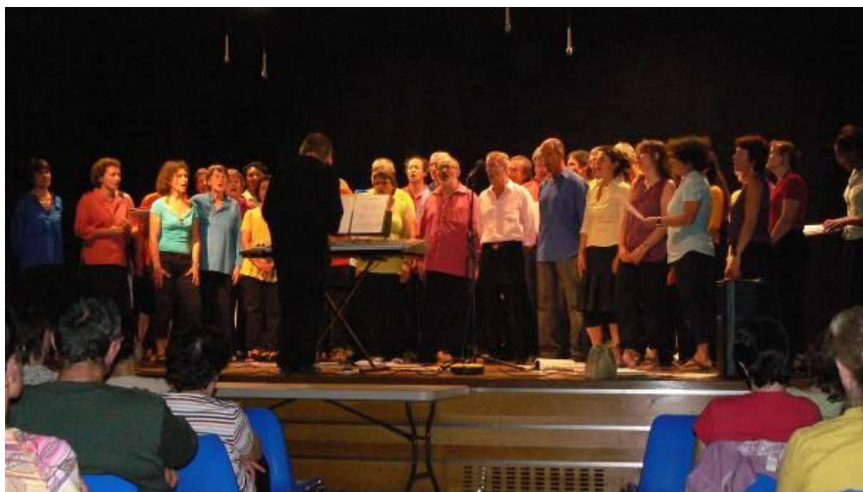
Concert de chorales