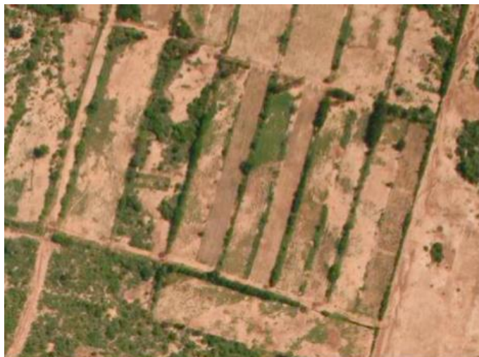
Wégoubri, le bocage Sahélien en langue mooré

L'ONG Terre Verte a été créée en France en 1989 pour venir en appui à la Ferme Pilote de Guiè créée la même année au Burkina Faso par l'Association locale Zoramb Naagtaaba (AZN) de Guiè. Depuis, la ferme se consacre à restaurer les sols désertifiés de sa région, au travers de plusieurs techniques qui convergent vers un renouvellement du système agricole par la création d'un bocage (embocagement).