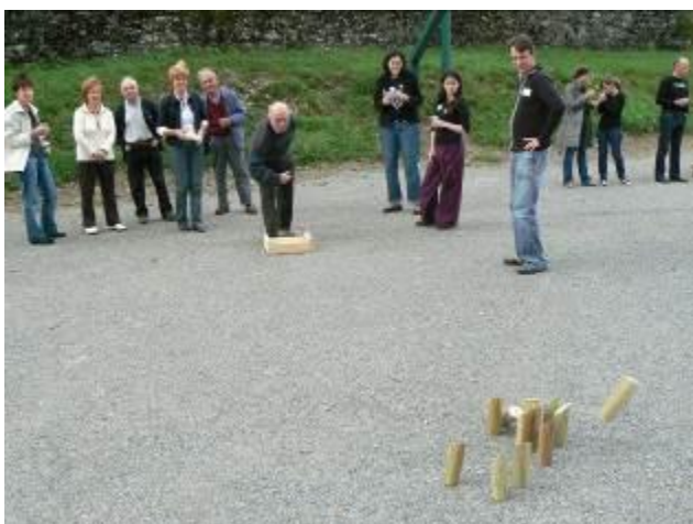
« Faites des jeux »

Nous contribuons aussi par ce biais à l'animation de notre ruralité et au développement économique local.