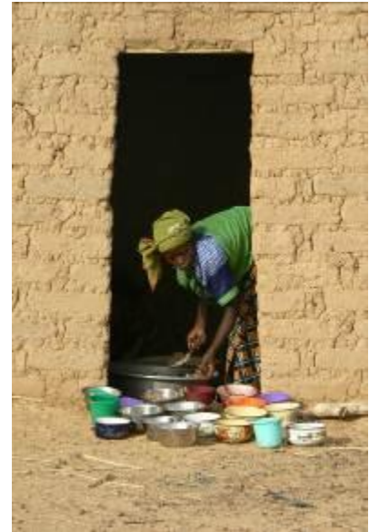
La distribution des repas