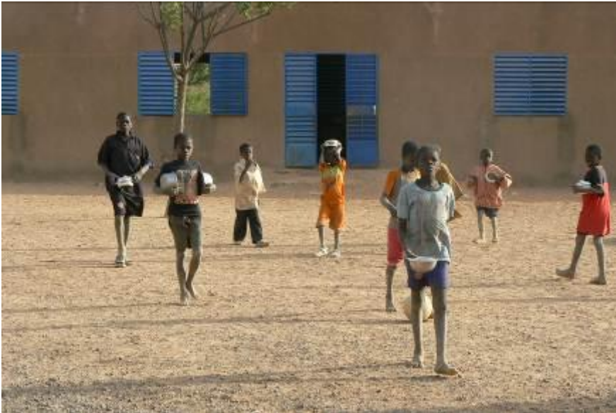
Les élèves allant à la cantine