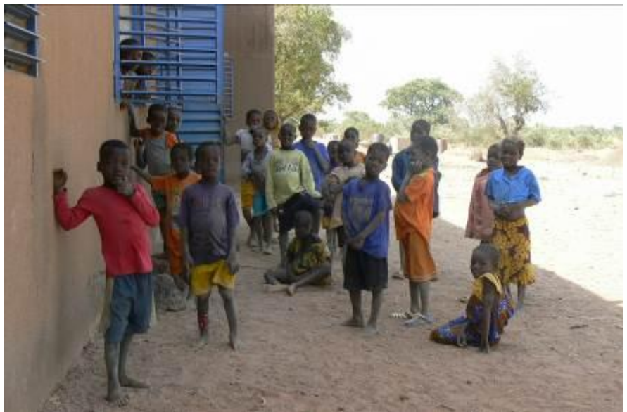
Dans la cour

Les conditions de travail à l'école de Babou sont déplorables. Il faut beaucoup de courage pour y enseigner et y étudier. Ces conditions entraînent une baisse des inscriptions et de la fréquentation des élèves inscrits.