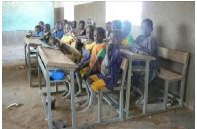
La classe des CP